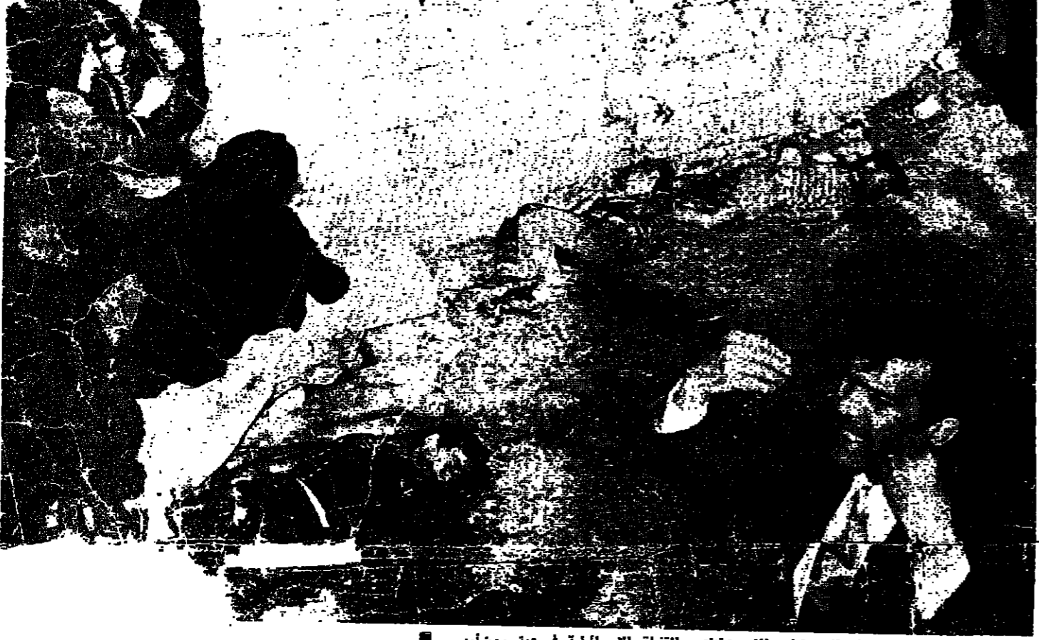
جثث الاطفال الضحايا الذين قتلهم القنبلة الاسرائيلية في عيترووت امس

قال مصدر رسمي في بيروت ، ان الرئيس فرنجييه سيصل الى دمشق اليوم الاحد ، لحضور مؤتمر قمة ريماسي مع الرئيسين السادات والاسد والسيد ياسر عرفات . وذكر المصدر ان الرؤساء الثلاثة والسيد عرفات سيبحثون تطورات الوضع العربي وخطة العمل في المرحلة الثانية المقبلة . وقد وصل الى دمشق مساء امس ، قلمنا من عمان ، الرئيس السادات . وكان الرئيس الاسد في استقباله بالمطار . وبدأت المحادثات بين الرئيسين على الفور . كما وصل الى العاصمة السورية مساء امس ، السيد عرفات قلمنا من ليبيا حيث افتتح اسبوع فلسطين . السادات لا يدخل لجنيف وكان الرئيس السادات قد أعلن